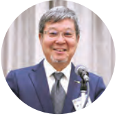
野井 和 重 会長エレクト・副会長 丹生都比売神社パンフレットご案内