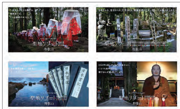
岸本知事の講話資料より