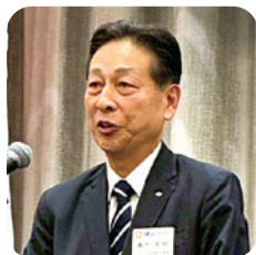
出席表彰者を代表して 島村会員ご挨拶