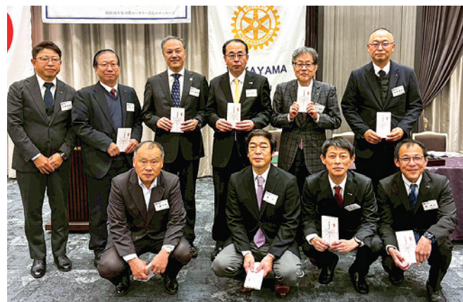
2年間 塚本会員、1年間 坂東会員、福辺会員、秦会員、 林会員、中野会員、西岡会員、田村会員、上園会員