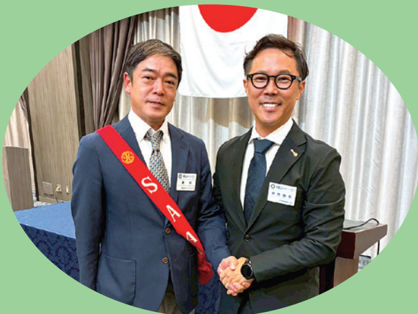
S.A.A.のタスキは岩西S.A.A.から次期 秦S.A.A.へ