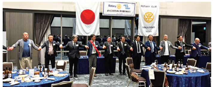
最後は全員で「手に手つないで」!!